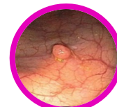
Pólipo en colon